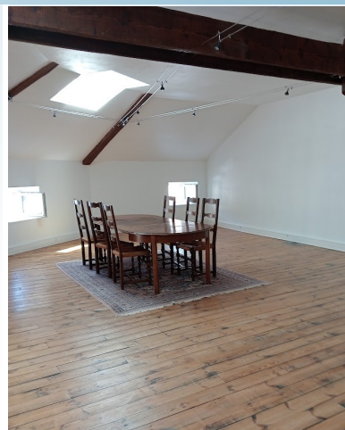
La salle de réunion

Nous proposons à nos confrères et partenaires de bénéficier des atouts de cette maison et faciliter ainsi les possibilités de remplacements et l'accueil des stagiaires.