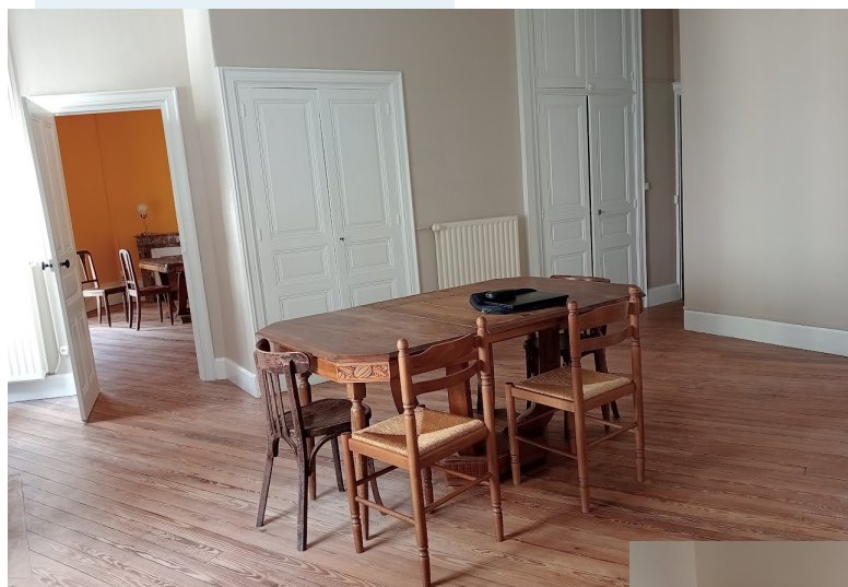
La salle à manger et la cuisine ouverte